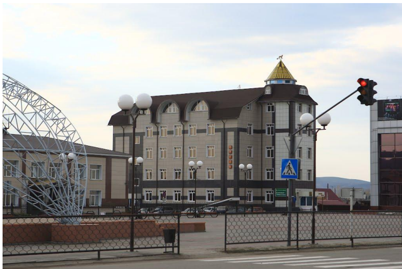
На фото: площадь Юбилейная.

На пересечении улиц Ленина и Алтайской расположен перекресток, который выполняет функцию центральной площади, которая названа Юбилейной в честь 200-летия села Майма.