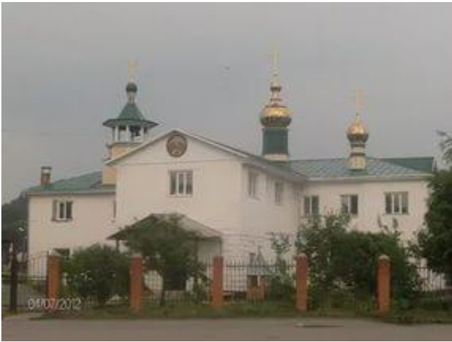
На фото: Храм Сошествия Святого Духа, ул. Советская.